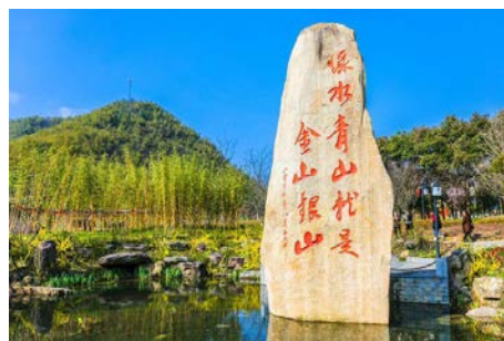
图1 浙江安吉余村“绿水青山就是金山银山”石碑 Fig.1 Stone tablet of "lucid waters and lush mountains are invaluable assets" in Yu Village, Anji, Zhejiang Province

“两山”理念的提出,首先在于其作为一种发展的价值判断,对规划的主体提出了新的要求,即“鱼和熊掌不可兼得的时候,要知道放弃,要知道选择” 6] 。要树立保护和改善自然生态环境就是解放和发展生产力的价值观念,摒弃以牺牲自然生态环境效益谋取一时经济增长的生产观念与做法,顺应人民群众对良好生态环境的期待,积极推进绿色可持续发展、高质量