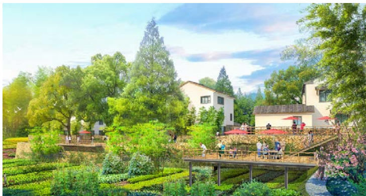
图3 浙江安吉天荒坪镇余村村庄规划——村居设计 Fig.3 Planning of Yu Village, Tianhuangping Town, Anji, Zhejiang Province (residential design)