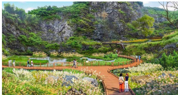
图4 浙江安吉天荒坪镇余村村庄规划——矿坑生态修复 Fig.4 Planning of Yu Village, Tianhuangping Town, Anji, Zhejiang Province (mining pit ecological restoration)