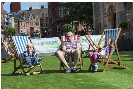
图2 圣约翰教堂快闪公园

2016年,利兹市议会与“儿童友好型利兹”(Child Friendly Leeds)组织合作,在市中心的公共空间设置了快闪公园(Pop-up Park)。快闪公园是指未被充分利用的(城市)空间通过美化被临时或永久地改造成的户外活动场地 [20] ,一般位于很少有传统公园且人流密集的市区。改造方式通常包括限制机动车交通、设置可移动拆卸的装置等。快闪公园鼓励儿童和家庭更多地使用公共空间,利用更多的时间进行户外娱乐。例如,圣约翰教堂(St John's Churchyard)的快闪公园设置有可攀登的雕塑、长凳和植物,形成一个临时的游戏空间(见图2)。公园在整个暑假期间开放,目的是为儿童提供在市中心玩耍的空间。利兹市议员朱迪斯·布莱克(Judith Blake)表示,“圣约翰教堂的快闪公园为利兹市中心带来