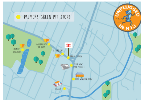
图3 Palmers Green社区“安全点”地图 资料来源: https://www.facebook.com/playquarter/ 。

当前我国尚未将儿童游戏权利纳入国家的法律政策中,在国家 and 地方层面对儿童游戏的意义重视不足。在我国城市规划相关的政策