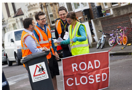
图6 英国志愿者参与“游戏街”活动 资料来源: https://playingout.net/enabling-street-play-supporting-resident-led-movement/ 。

与维护,更离不开社会公众的重视与支持。一个“儿童游戏友好”的城市不仅需要政策环境、物质环境的构建,还需要社会环境的支撑。提高公众对儿童游戏的重视,是开展儿童游戏工作的基础。在完善的政策体系与制度构建下,地方政府可以与学校、社区、社会组织合作,进行广泛的社会宣传,提高公众意识,引导市民自觉维护城市中的儿童游戏环境,支持开展多样的户外儿童游戏活动。在英国,志愿者和游戏工作者是维护儿童游戏氛围的重要力量(见图6)。我国可以结合实际情况,考虑为儿童游戏工作建立专业标准和培训机制,使儿童游戏工作的开展更具专业性和科学性。构建良好的儿童游戏环境,需要地方政府、管理机构、城市规划师、组织团体和社区成员等主体的共同努力。