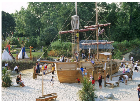
图1 威尔士戴安娜王妃纪念游乐场

冒险游乐场是一种特殊类型的儿童游戏场地,其中不设置人造的或结构化的游戏空间,儿童游戏不受限制,并通常有游戏工作者(或“管理员”)存在。从20世纪40年代开始,英国一直在社区和地方区域建设冒险游乐场。相比其他国家,英国的游乐场、学校操场等游戏场地普遍具有更多的冒险元素,包含更多自然式的设计,例如沙子、泥坑、树桩、轮胎、砖块等“高风险性”物品。冒险游乐场中的游戏工作者负责保障儿童的安全,他们密切关注儿童的活动但不会进行过多的干涉。一位美国的风景区园林设计师使用兰德公司(RAND Corporation)开发的定量工具,通过视频跟踪18 000名伦敦游乐场游客的行为,然后将其与美国公园游客的行为数据进行比较。结果显示,英国的冒险游乐场多吸引了55%的游客,儿童和青少年的体力活动增加了16%—18%,沙、草、高秋千和攀爬结构吸引儿童注意的时间更长 [18] 。英国的教育家和教育监管者认为,保护性的文化已经走得太远,从而使孩子们的童年缺少了一些有益的风险因素。越来越多的专家认为,接触可控的风险是儿童发展过程中必要的经历,有利于帮助儿童建立韧性和毅力等素质。作为冒险游乐场的代表,伦敦市威尔士戴安娜王妃纪念游乐场(Diana, Princess of Wales Memorial Playground)为儿童提供多样化的开放式游戏选择,其最突出的特点是一个全尺寸的木制海盗船,作为孩子们的攀爬区域,周围是沙子,可供孩子们在其中玩耍(见图1)。冒险游乐