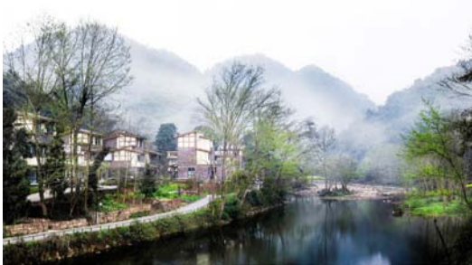
a 邛崃市夹关镇周河扁聚居点建设实景图