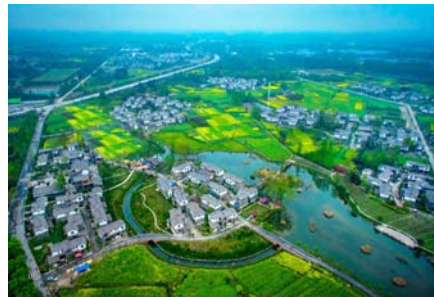
b 郫都区青杠树村聚居点建设实景图