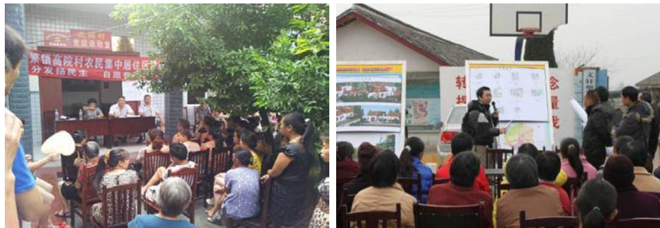
图3 乡村规划师为报名参加农村新型社区建设的村民宣讲规划设计方案