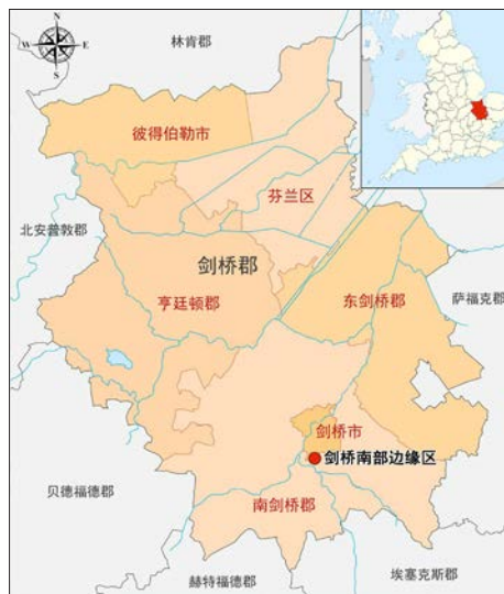
图1 南剑桥郡的地理位置

（1）在城市扩展区的发展上，《行动计划》综合考虑了交通可达性及设施服务水平等现状配套条件，由此选定位于公共交通走廊上（带有停车换乘系统）、周边休闲游憩设施较完善的特兰平顿西部（Trumpington West）作为城市扩展区，以减轻新增的交通及公服配套压力。《行动计划》计划建设一个现代化、高品质、充满活力且创新独特的城市扩展区。在住房供给上，该地区将新建约600套住宅，并根据相关政策要求将安排至少40%的住房为保障性住房。这些保障性住房将以组团的形式进行开发布局，并根据其位置确定适当的建设规模。在交通可达性的提升上，《行动计划》拟在该地区建设公交专用道和自行车道，使城市扩展区与