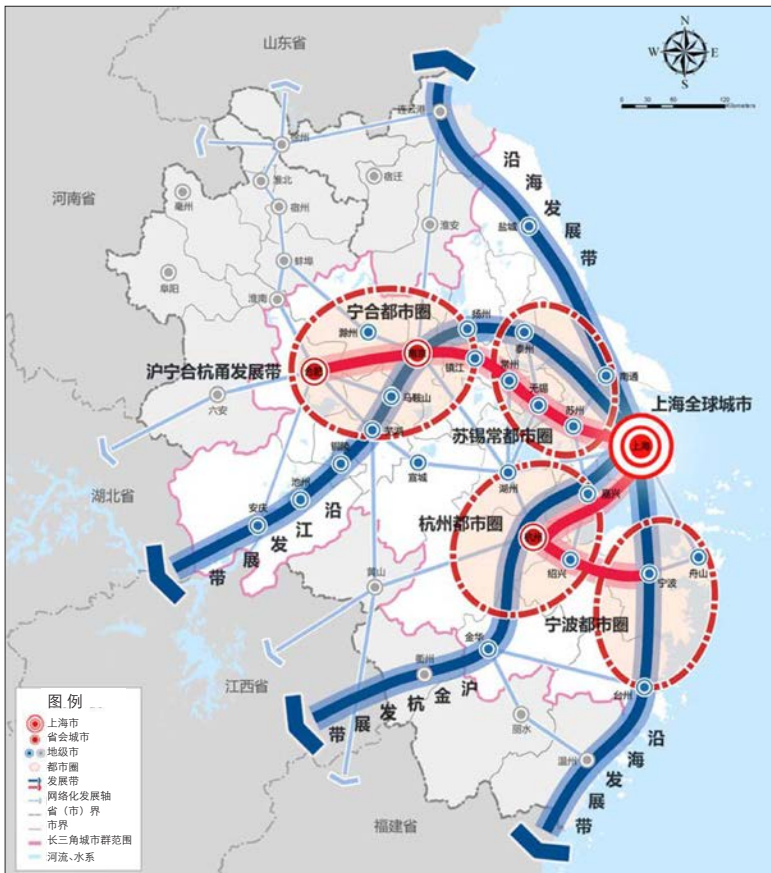
图1 长三角城市群空间格局示意图