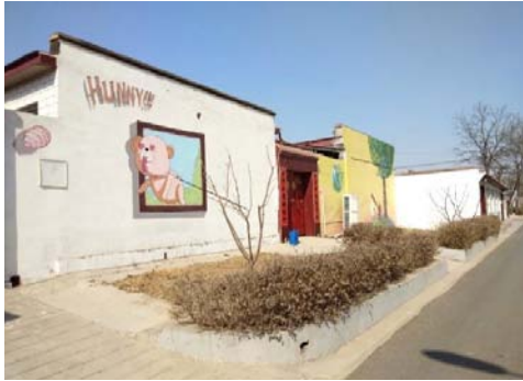
图3 半壁店村泰迪熊主题文化 资料来源:笔者自摄。