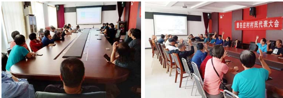
图5 董各庄村召开村民代表大会听取美丽乡村规划方案汇报

走乡村善治之路,复活乡村发展建设的议事规程,复活村规民约的治理作用,将村规民约作为规范村庄发展的重要手段。充分发挥村民主体作用,健全完善美丽乡村规划建设的长效管理机制,进一步完善台账管理,确保乡村社会充满活力、和谐有序。发挥乡贤在村庄发展中的引领作用,乡贤一方面扎根本土,对乡村情况比较熟悉;另一方面具有新知识、新眼界,对现代社会价值观念和知识技能有一定把握。新乡贤文化作为一种“软约束”“软治理”,有利于健全乡村居民利益表达机制,营造新乡贤参与家乡建设的氛围,激发村民参与乡村事务的积极性,建设乡村共同体,并提高其凝聚力和自治能力。新乡贤的示范引领作用,能教化乡民、反哺乡里、涵养文明乡风,使村民遵循行为规范、价值导向。