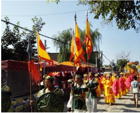
图2 范各庄村关帝庙及太后巡礼活动 资料来源:网络图片。