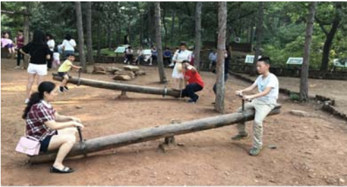
图4 乡土特色村口标识及健身设施

感。例如大兴区半壁店村泰迪熊小镇,引入文创企业,在得到村民认可后,承租村民民居,将村内闲置宅院打造成泰迪熊主题乐园,依托现有民宿村居进行升级改造,保留原有村庄脉络,建设泰迪熊博物馆、泰迪民宿餐饮、星级户外活动区3大主题区,发展特色旅游业,吸引大量游客前来参观,人均纯收入位于镇域前列 [7] (图3)。