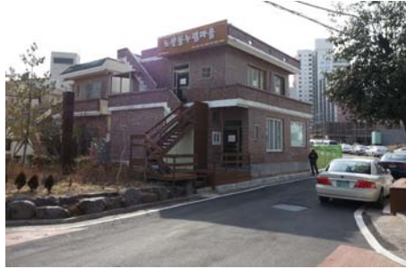
b) 图书咖啡馆 (社区企业2号店)