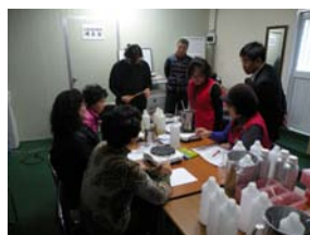
b) 社区企业进行产品教育