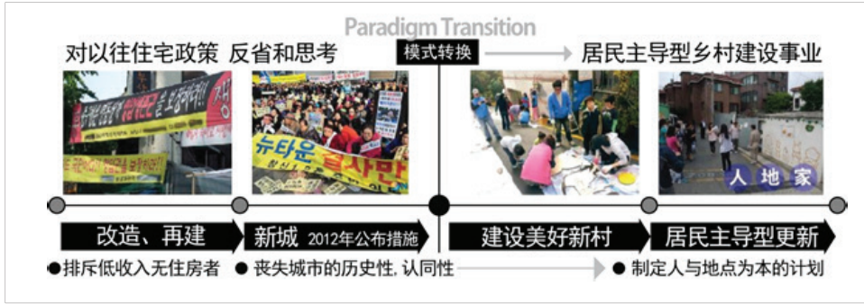
图1 旧村更新的时代潮流