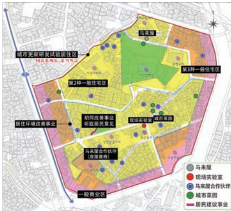
图2 芦山洞地图