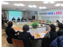
a) 社区企业成立大会