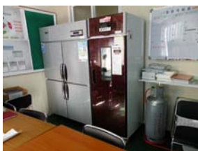
a) 社区企业购置设备