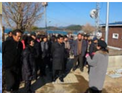
c) 实地考察类似案例地区