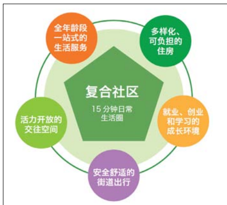
图2 15分钟社区生活圈