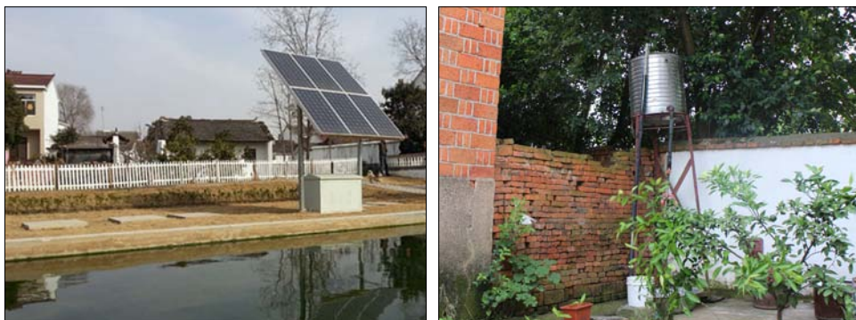
图5 污水处理设施