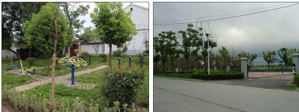
图4 村广场和体育设施