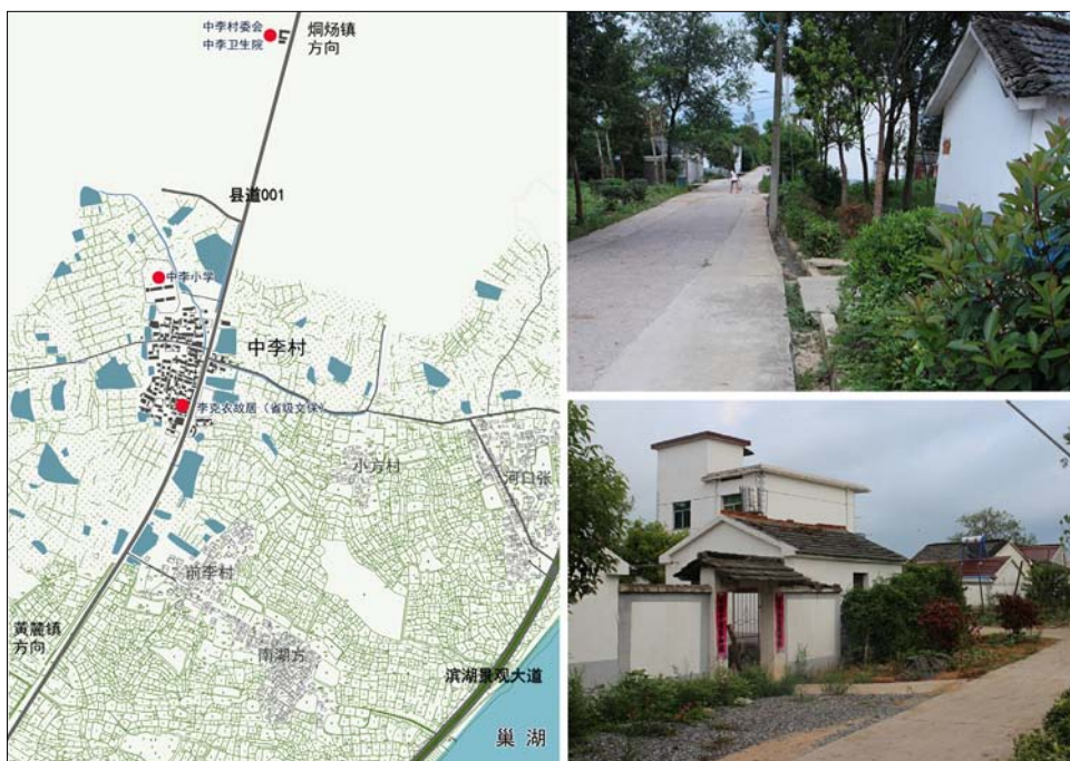
图6 中李村环境面貌

而来的旅游业及其附属性的服务业发展，一个非常重要的变化就是就业岗位的正正规趋势。即使在农庄里，也大多采用雇佣的全职岗位方式，虽然还有相当部分因农忙农闲而发生变化的临时工；其他如村里明显增加的公共服务功能，也带来了新的就业岗位。随着新的就业岗位不断流入，中李村从就业角度来看，正在从非常传统的农业型村庄，快速向非农为主、村民广泛兼业的新阶段发展。相比传统的更具身份色彩的从事农业的农民而言，“上班”这一工作方式的转变，正从更为立体的层面产生着深刻的影响。