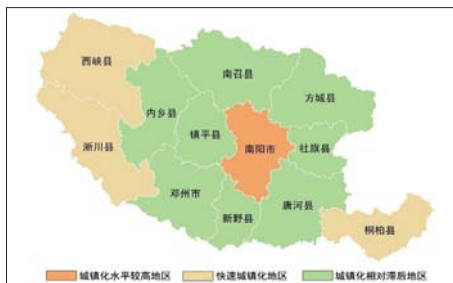
图2 南阳市城镇化空间格局分类 (2010年)