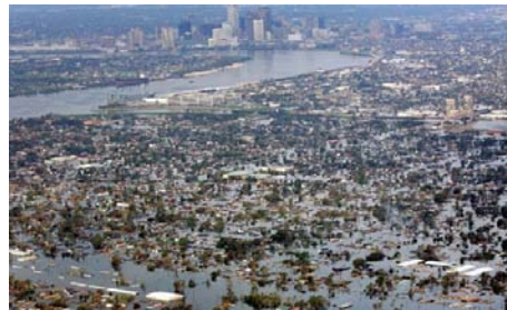
图1 新奥尔良市被“卡特里娜飓风”破坏

因此,一些学者、政府机构开始从经济、社会、生态、防灾等不同的角度提出韧性城市建设的理念。美国国土安全部(Department of