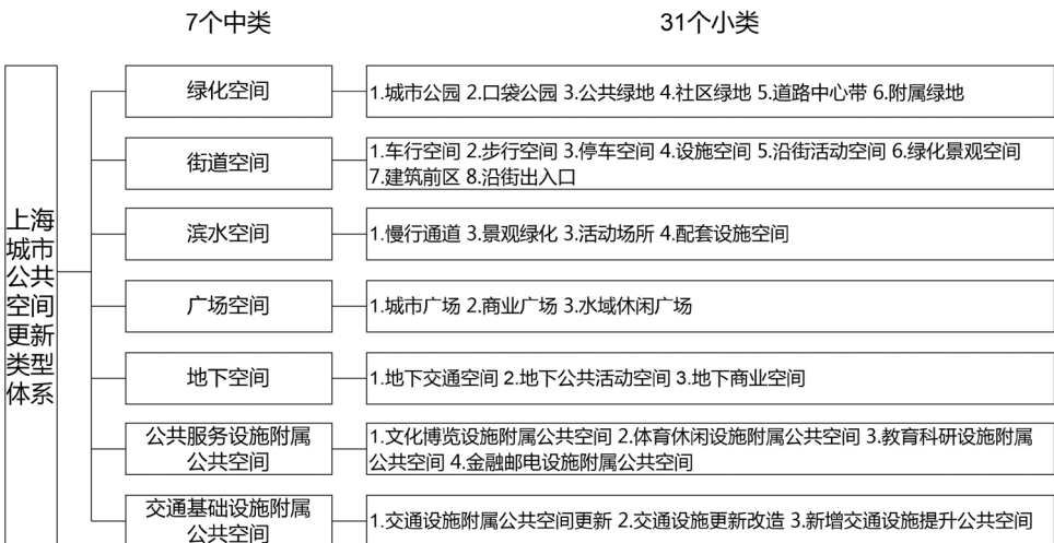
图1 上海城市公共空间更新类型体系 Fig.1 Urban regeneration type system of public space in Shanghai

第一大类住区更新,包括里弄住宅、花园住宅、公寓住宅、工人新村(含职工住宅)、商品住宅和城中村6种类型;第二大类历史风貌保护更新,包括历史文化风貌区、风貌保护街坊、风貌保护道路(街巷)、风貌保护河道、保护建筑和保留历史建筑6种类型;第三大类公共空间更新,包括绿化空间、街道空间、滨水空间、广场空间、地下空间、公共服务设施附属公共空间和交通设施及附属公共空间7种类型;第四大类工业更新,包括用地性质不变、功能不变,用地性质不变、功能转变,以及用地性质转变3种类型;第五大类商业商办更新,包括商业商办楼宇类、商业街类和商圈类3种类型;第六大类综合区域更新,包括中心区、滨水区、综合交通枢纽区和工业区4种类型。通过6个大类、29个中类的划分,结合具体的类型特点,再进一步细分小类,从而建立内涵丰富的上海城市更新类型体系;针对每一类型的特征,结合优秀的更新案例经验剖析,总结提炼具有针对性的更新策略和方法建议。