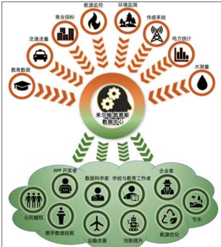
图2 米尔顿·凯恩斯数据中心