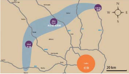
图4 剑桥—米尔顿凯恩斯—牛津无人驾驶高科技交通走廊

Fig.4 Cambridge-Milton Keynes-Oxford high-tech corridor for driverless transport