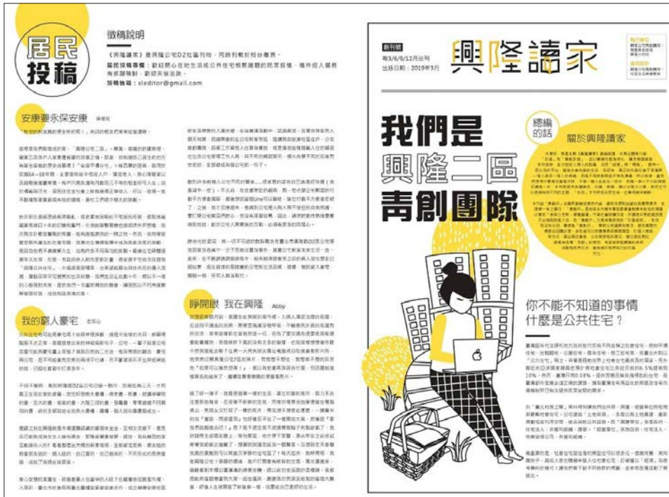
图2 兴隆社会住宅社区报纸示意图 Fig.2 Community newspaper of Xing-Long social housing