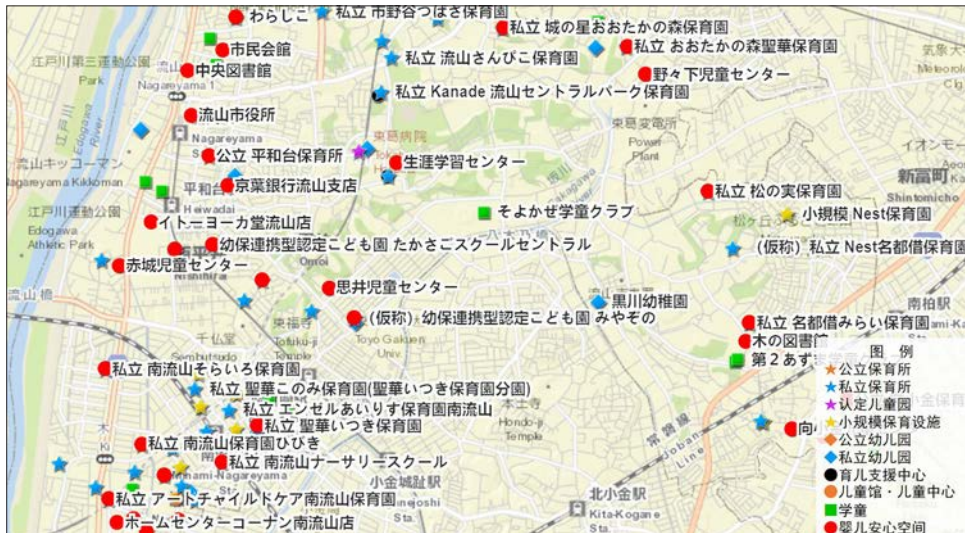
图3 流山市育儿设施类型分布图(部分)

Fig.3 Distribution map of childcare facilities in Nagareyama City (part)