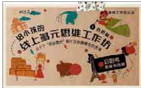
c 儿童之家活动海报