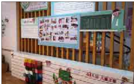
a 方松街道儿童之家内景

站在儿童视角来看社区友好度，包括理念、空间、服务和文化等方面 [5] ，从空间友好角度分析松江新城，包括儿童视角下的活动阵